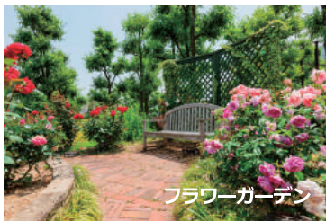
フラワーガーデン